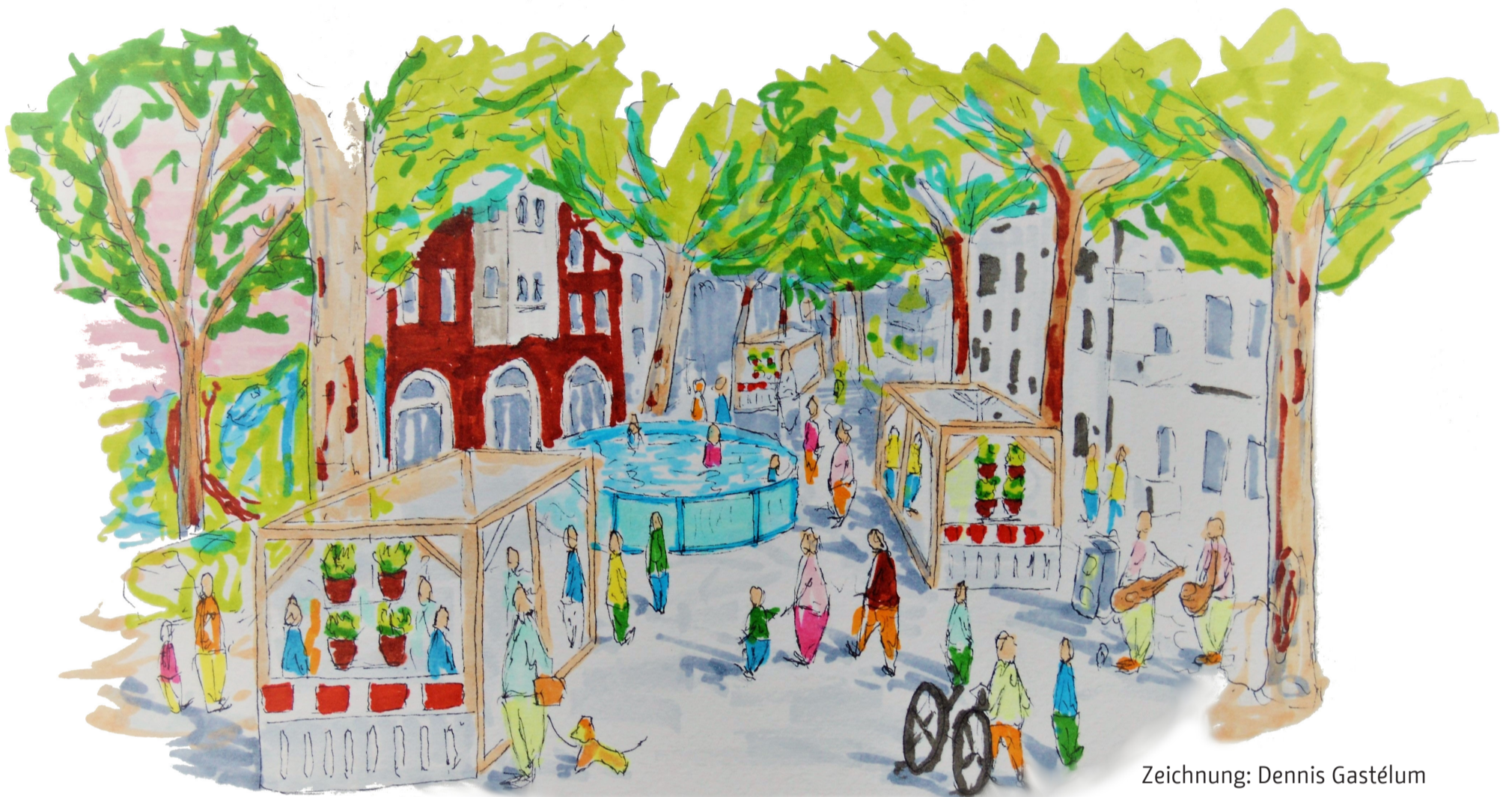
Zeichnung: Dennis Gastélum