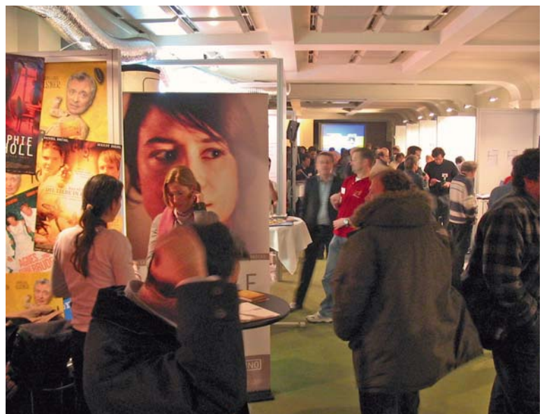
2005 · Auf der Medienmesse wird das breite Spektrum der Medienszene rund um die Potsdamer Straße sichtbar.