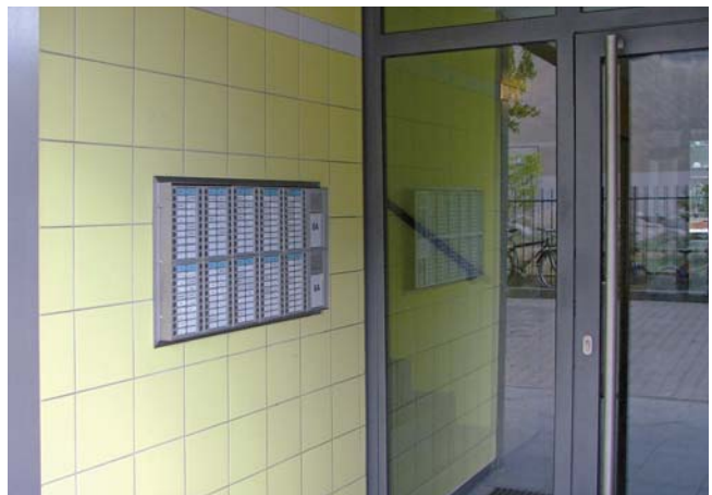
Die Eingangsbereiche wurden 2003 neu gestaltet. Die Aufnahme aus dem Jahr 2009 dokumentiert den Wandel.

Projekte im Pallasseum (Auswahl): ..... Etablierung und Begleitung des Mieterbeirates 1998..... Neugestaltung von Eingangsbereichen ab 1999 ..... ..... Kinderfeste ab 1999 ..... Nikolausmarkt 1999 ..... Trödelmarkt ab 1999 ..... Namenswettbewerb 2000 ..... Aufbau eines Internationalen Chors 2004 ..... Ausstellung ‚Schöne Aussichten‘ 2004 ..... Neugestaltung des Spielbereiches im 2. Hof 2004 ..... Anlage von Mietergärten