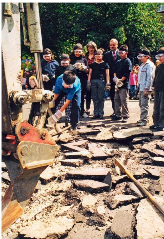
2002 · Start für die Neugestaltung des Schulhofes: Schülerinnen und Schüler helfen bei der Beseitigung der dicken Asphaltsschicht tatkräftig mit.