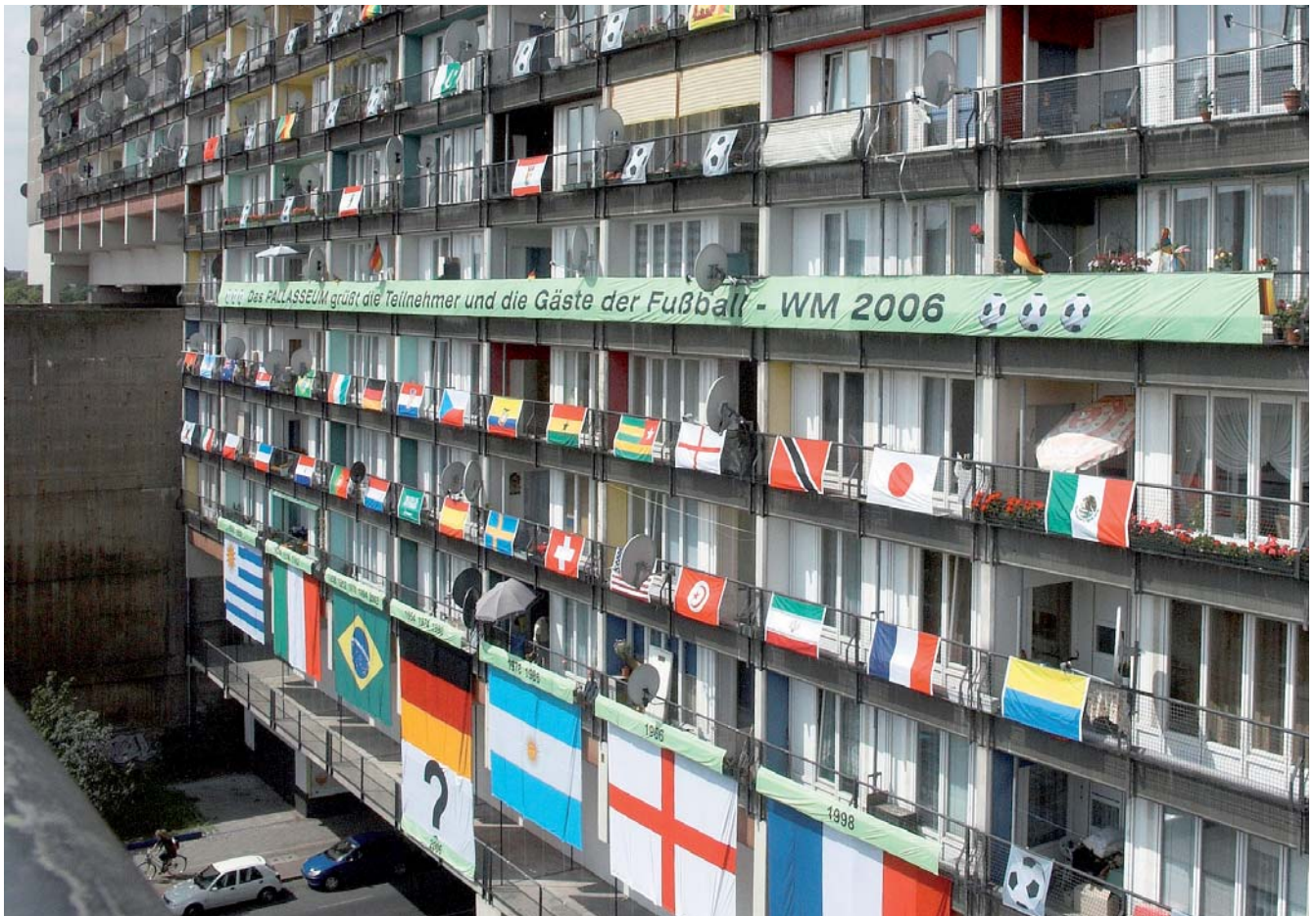
Das Pallasseum zeigt Flagge: Mit ihrer Aktion zur Fußball-WM 2006 erreichen die Mieterinnen und Mieter der Großwohnanlage internationale Aufmerksamkeit.

Es gab einen Wettbewerb für einen neuen Namen. Unter 107 Vorschlägen wählte eine Jury den der elfjährigen Meliha Eroglu aus: Pallasseum. Die Taufe war im März 2001. Der Name setzte sich durch. Die Eigentümergesellschaft heißt jetzt Pallasseum Wohnbauten KG.