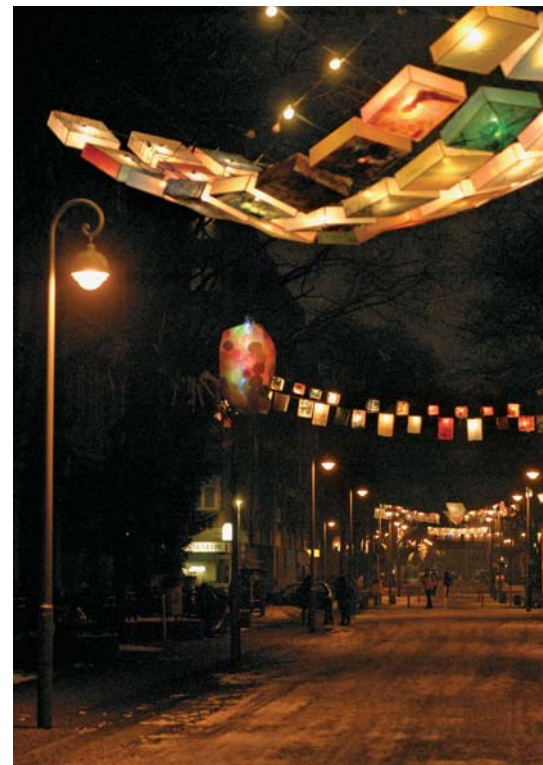
Wenn es Nacht wird in der Steinmetzstraße: Die Lichter-Galerie zum Jahreswechsel 2007/2008.

„Vor 10 Jahren haben die Menschen nur nebeneinanderher gelebt. Jetzt ist viel mehr Miteinander – das ist eine echte Veränderung durch die vielen Projekte, die Menschen zusammenbringen. Ich nenne meine Kinder auch die ‚QM-Kinder‘ – es sind sehr fröhliche Kinder, man redet nicht mehr über Gewalt, sondern nur noch, was die Kinder noch alles machen können.“