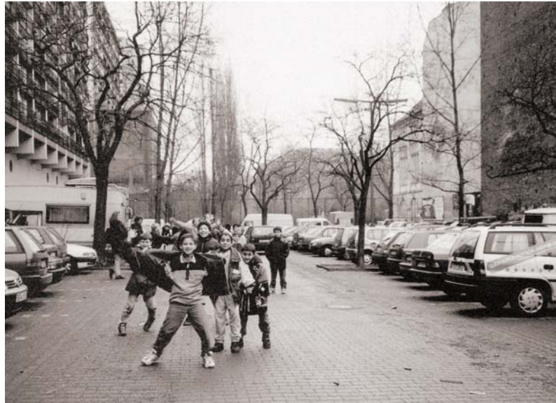
1999 · Ein Parkplatz für 220 Fahrzeuge

Auf Parkplätzen entwickeln sich keine Nachbarschaften. Aber auf Plätzen und Spielplätzen. Eines der ersten Projekte des Quartiersmanagements Schöneberger Norden war von 1999 bis 2001 die Schaffung eines Parks anstelle des Parkplatzes Pallasstraße 7. Wo gebaut wird, sehen die Anwohnerinnen und Anwohner, dass sich etwas ändert. Für viele war es ungewohnt,