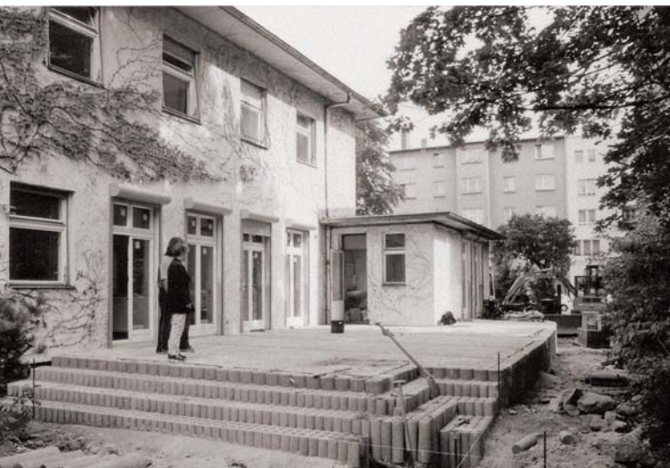
2000 · Der Familientreffpunkt Kurmärkische Straße: Die Terrasse entsteht.