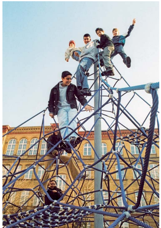
... gemeinsames Spiel und kaum noch Streit

„Die Schule ist der Tanker, der Nachbarschaftstreff sein Beiboot, oft sein Schlepper. Gemeinsam stabilisieren sie den Kiez.“