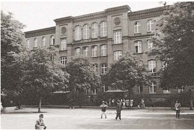
Der Schulhof der Neumark-Grundschule 1999 ...