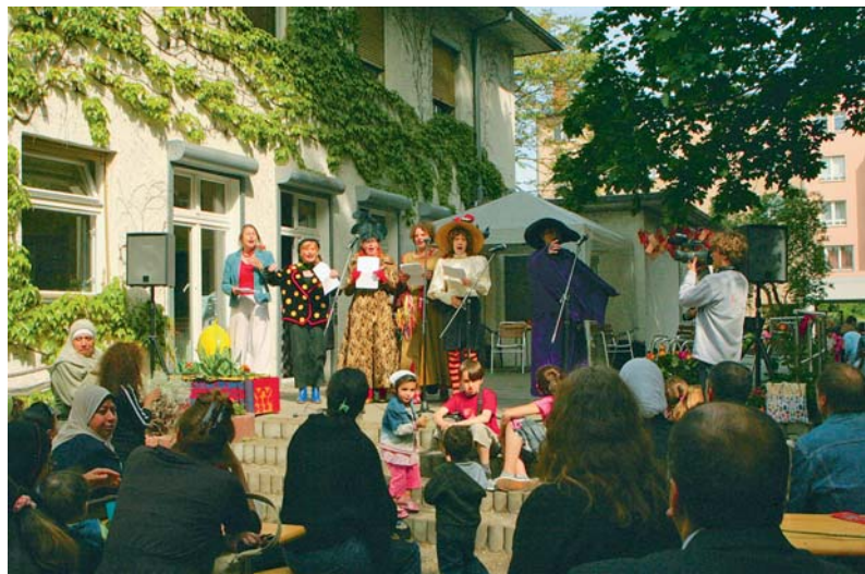
2009 · Ein Grund zum Feiern: 10 Jahre erfolgreiche Nachbarschaftsarbeit

Gegenüber, in der Kurmärkischen Straße 2–8, wurde der Hof der Kindertagesstätte umgebaut. Kinder, Eltern, Erzieherinnen und Erzieher waren in die Gestaltung einbezogen, auch das abschließende Fest im August 2004 wurde gemeinsam vorbereitet. Kreisförmig angelegte Wege eignen sich zum Rollern und Rennen. Zum Ausruhen gibt es eine Waldecke mit einer überdachten Schutzhütte. Ein Hügel ist mit robusten Büschen und Gehölzen bepflanzt, ein Spieltunnel schafft Möglichkeiten zum Verstecken. Es gibt neue Spielgeräte. Ein Nutzgarten mit Obststräuchern, Gemüsepflanzen und Kräutern lädt zum Riechen, Schmecken und Betasten ein.