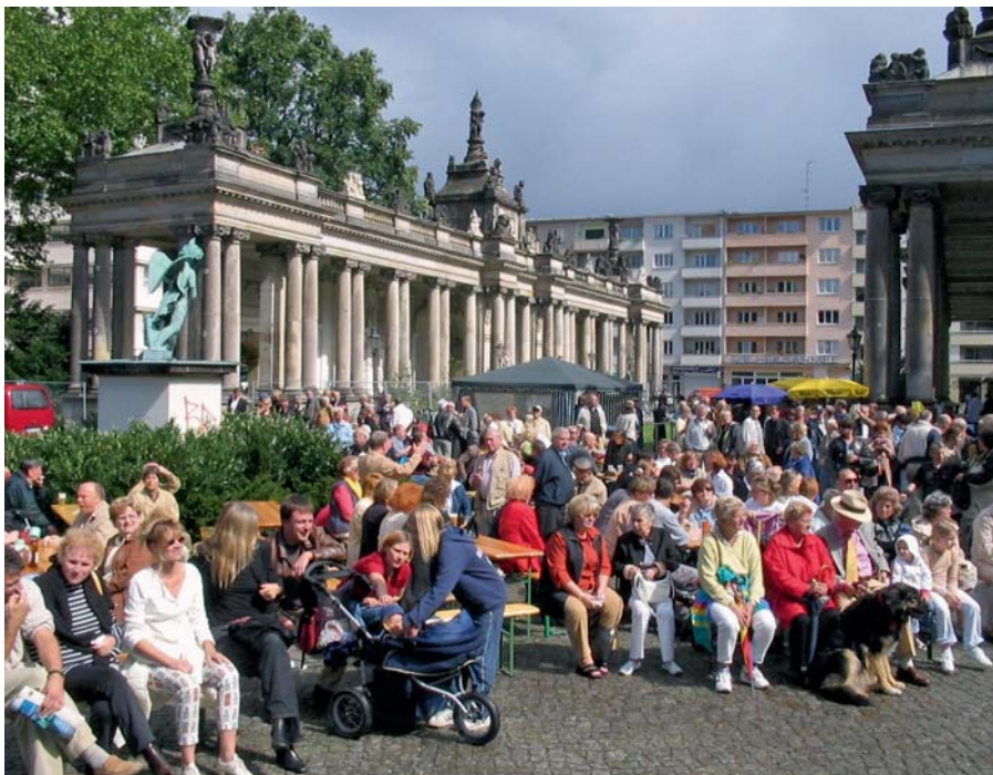
2003 · Jazz an den Kolonnaden: Die Konzerte im Kleistpark, in den Sommern 2003 bis 2005, waren ein Erlebnis auch für diejenigen, die bis dahin den Park noch nicht für sich entdeckt hatten.