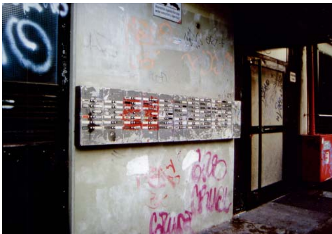
Veränderungen im Detail: 1999 zeugten auch die Klingelbretter vom Zustand der Wohnanlage ‚Wohnen am Kleistpark‘.

Die abfällige Bemerkung des Politikers Landowsky 1998: „Man muss den Mut haben, Gebäude wie das NKZ oder den Sozialpalast in Schöneberg zu sprengen“, hatte alle empört, man wollte weg vom Schmutzimage, das auch nach den ersten Erfolgen immer wieder von Politik und Presse herbeizitiert wurde. Im Schöneberger Morgen schrieb der Mieterbeirat: „Wir aber halten in dem unerschütterlichen Glauben durch, dass sich etwas verändern lässt, und weil wir um die Vorzüge unserer Wohnungen und ihrer Lage wissen. Der Blick auf Berlin ist atemberaubend.“