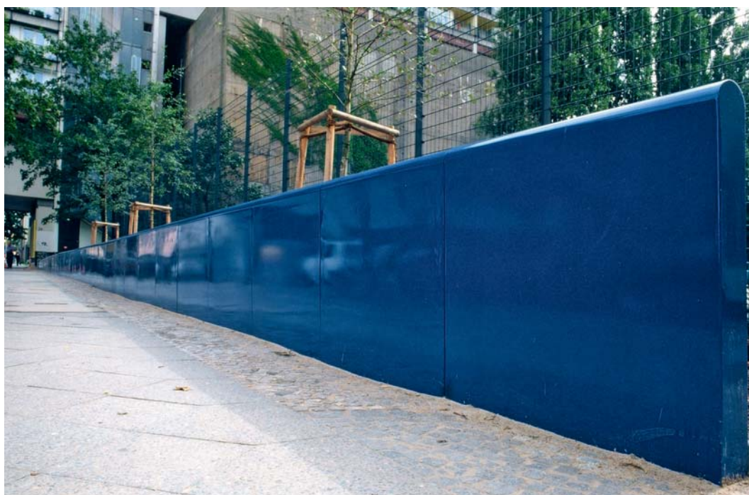
Ort der Erinnerung: Die Stahlskulptur ‚Das blaue Band‘ erinnert an die ukrainischen Zwangsarbeiter, die 1943–1945 den Hochbunker Pallasstraße bauen mussten. Sie waren im Schulgebäude der heutigen Sophie-Scholl-Oberschule interniert, unter ihnen viele Frauen und Kinder.

Schon bei der Planung des PallasParks gab es die Idee, den Vorplatz mit einem Café zu beleben. In der Pallasstraße 8/9 ermöglichte ein Umbau die Einrichtung des Café Palladin. Mit einem Durchbruch zum Vorplatz des PallasParks wurde eine Terrasse geschaffen, die den Platz aufwertet und die Aufenthaltsqualität erhöht. Das schöne Café ist ein ambitioniertes Ausbildungsprojekt, seit 2003 werden hier Jugendliche zu Konditoren und Konditorinnen und zu Fachkräften im Gastgewerbe ausgebildet, mit großem Erfolg. In der Pallasstraße 14 ist im März 2008 die Kochschule Palladin dazu gekommen. Mit beiden Projekten werden ver-