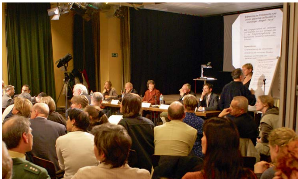
Eine Sondersitzung des Präventionsrates Schöneberger Norden am 11. Oktober 2007