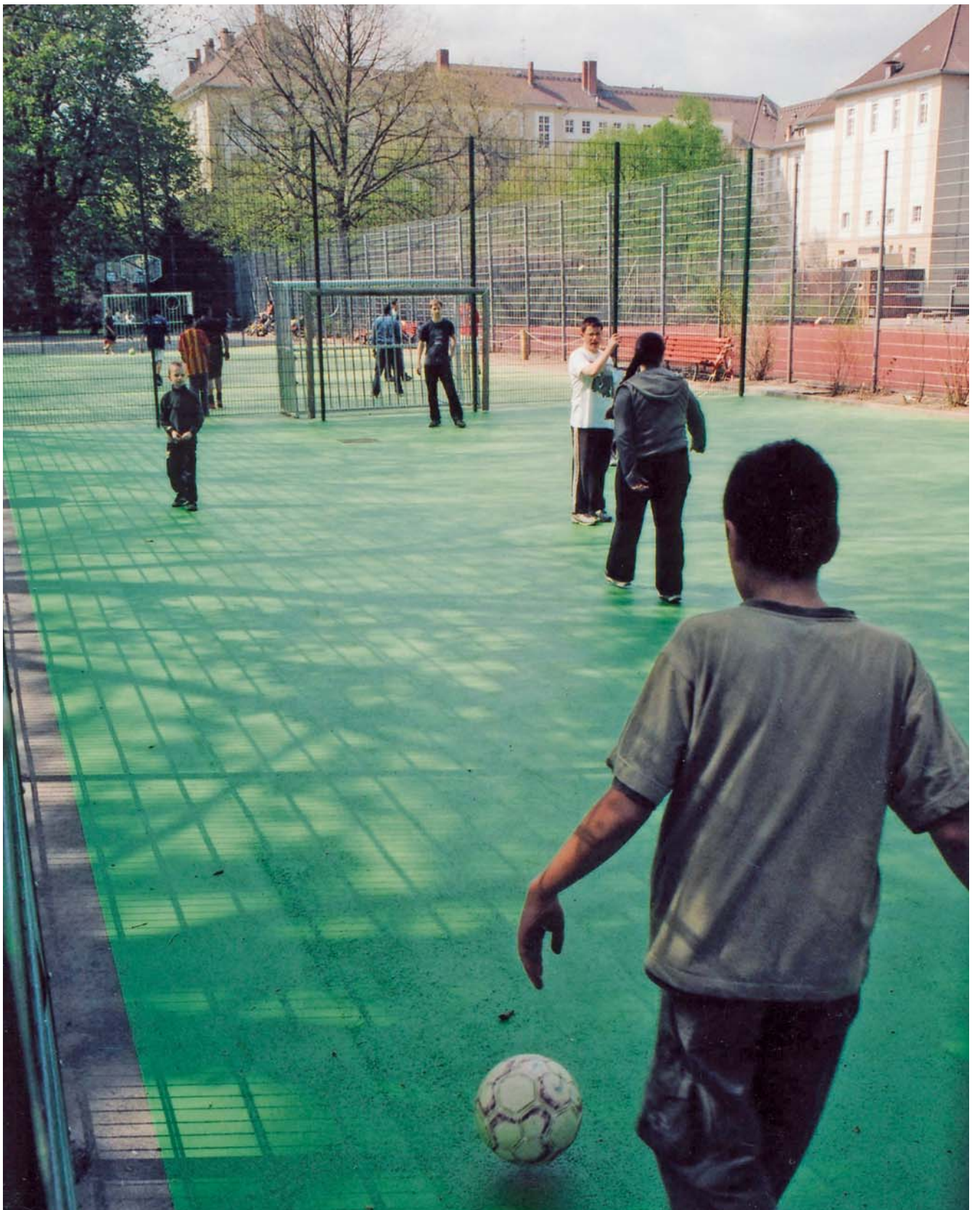
Wo nach 1945 vor dem Sitz des Alliierten Kontrollrates Panzer auffuhren, kicken heute Jugendliche auf der neu geschaffenen Spielfläche im Kleistpark.