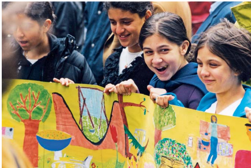
So fing alles an: Ideen und Wünsche der Kinder für den PallasPark 1999. Vieles hat sich erfüllt.

schiedene Ziele verfolgt: Jugendlichen mit schwierigen Biografien wird eine Ausbildungschance geboten, und die Gegend wird durch gute gastronomische Tagesangebote attraktiver. Der Mittagstisch im Café Palladin ist ein echter Renner und wird gerne von den Beschäftigten der umliegenden Behörden und Schulen genutzt.