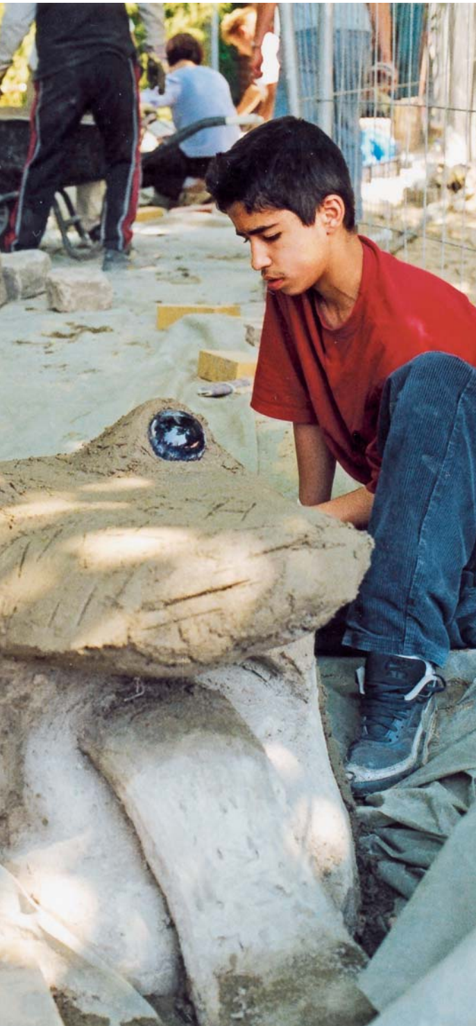
Tierischen Spaß haben die Schülerinnen und Schüler der Spreewald-Grundschule beim Modellieren ihrer selbst entworfenen Skulpturen im Gleditschpark.