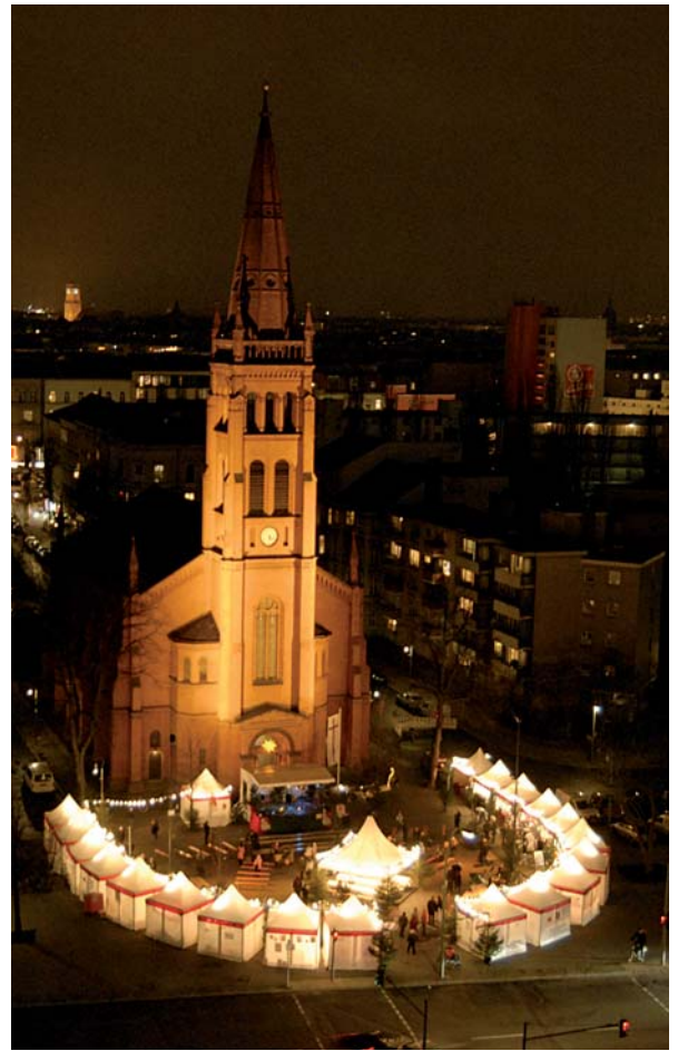
Nikolausmarkt 2008 auf dem neugestalteten Stadtplatz vor der Zwölf-Apostel-Kirche. Eine Initiative von Gewerbetreibenden im Rahmen des QM Magdeburger Platz.