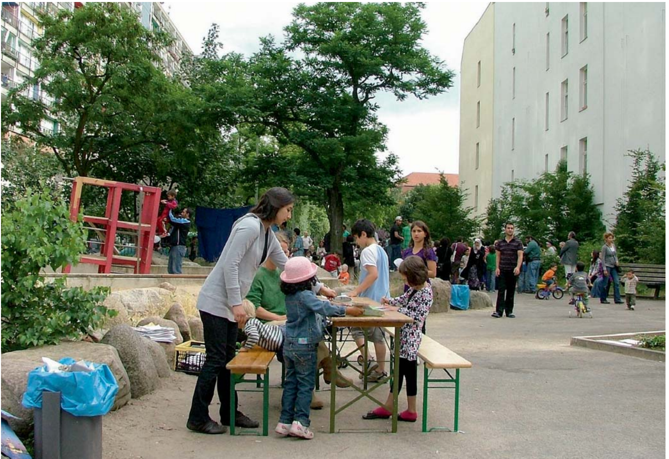
2009 · Kunst und Poesie im PallasPark

2009 wurde von einem Verein aus engagierten Bewohnerinnen und Bewohnern des Schöneberger Nordens organisiert, von denen einige auch als Quartiersräte aktiv sind. Der Verein will den Pallas-Park weiterentwickeln zum Interkulturellen Garten der Künste .