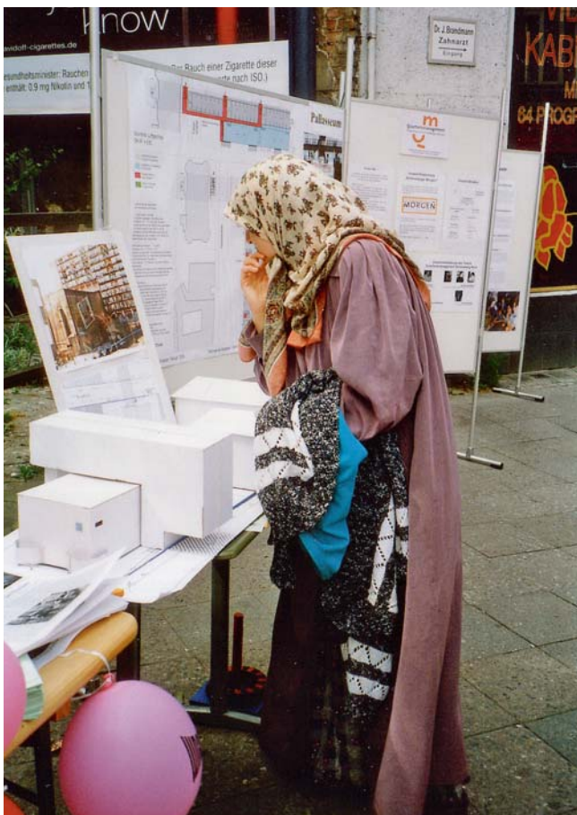
Planung für die Wohnanlage ‚Wohnen am Kleistpark‘ 2000. Bewohnerinnen und Bewohner erreicht man vor der eigenen Haustür am besten.

Quartiersrat, hat 25 investive und soziokulturelle Projekte mit auf den Weg gebracht. Seit Mai 2006 gibt es den Quartiersrat (QR) Schöneberger Norden. Das Gremium besteht gegenwärtig aus 20 Anwohnerinnen und Anwohnern und 12 lokalen Akteuren.